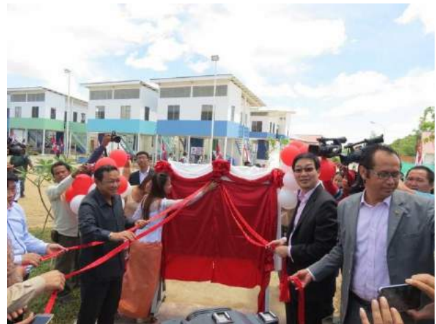
Inauguration de Smile Village le 26 septembre 2015

Avec le soutien de l'ONG STEP de Singapour, de l'association de Bon Cœur (Nouvelle Calédonie), des antennes PSE Luxembourg, For a Child's Smile UK, PSE Aquitaine, PSE Basse Normandie, PSE Développement, PSE Paris/Ile de France, PSE Languedoc/Roussillon, PSE Nord et PSE Lyon via leurs différentes actions et leurs donateurs.