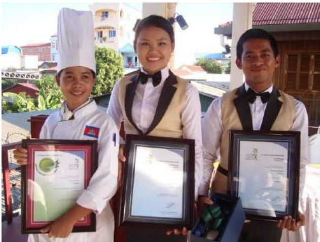
Concours de formation hôtelière de l'ASEAN à Hanoi (Vietnam). Médaille d'excellence pour nos étudiants de la filière Cuisine.

Les étudiants de l'École d'Hôtellerie et de Tourisme ont eu l'occasion de faire preuve de leurs compétences en participant à plusieurs concours culinaires, comme celui de l'ASEAN. La qualité de la formation, reconnue sur le marché cambodgien, est un véritable atout pour nos diplômés qui sont très vite recrutés.