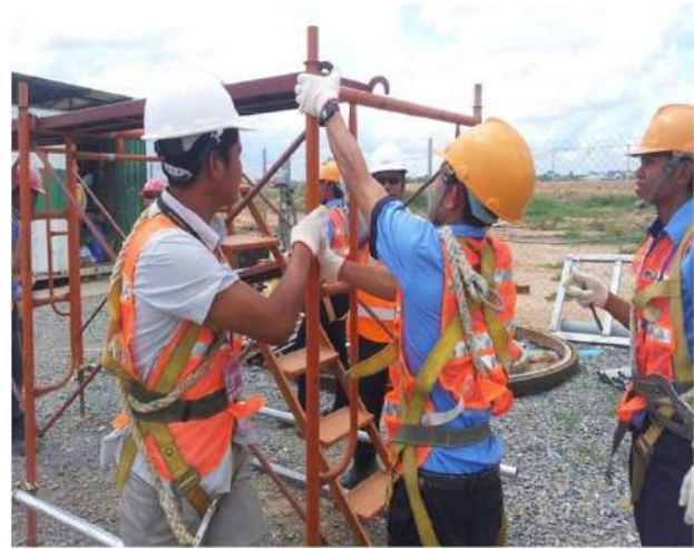
Formation au montage d'échafaudages, offerte par la Société Vinci Construction Grands Projets