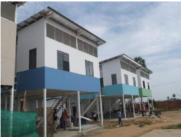
Maisons de la seconde tranche de construction, livrées en juillet 2015

Les enfants sont tous dans nos programmes, inscrits dans les écoles publiques voisines ou venant étudier dans notre Centre avec l'un de nos bus de ramassage scolaire.